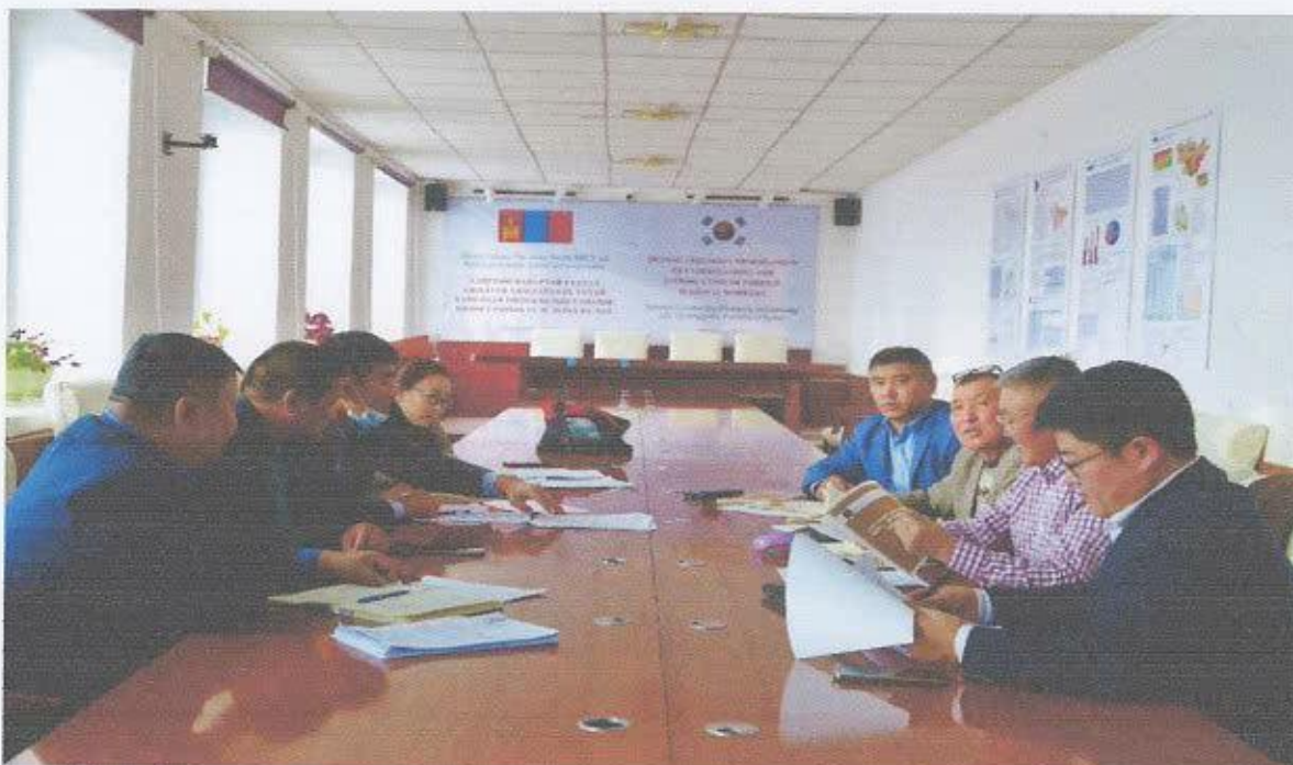
Аймгийн хэмжээнд хяналт шалгалт хийсэн ОУИТБС-ийн дэд зөвлөлийн бүрэлдэхүүн