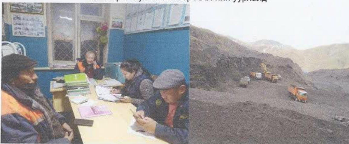
Бөхмөрөн сумын Хотгор ХХК-ийн уурхайд

Аймгийн хэмжээнд хууль бусаар алт олборлох явдал 2024 онд гараагүй. Өнөөдрийн байдлаар Тариалан сумын Бор хавцалд бичил уурхайгаар ашигт малтмал олборлох журмын хүрээнд 4 нөхөрлөлийн 30 гаруй иргэн ажиллаж байна. Бусад сумын сэжигтэй цэгт аймгийн экологийн цагдаа болон мэргэжлийн байгууллага сум орон нутгийн албан хаагчид тогтмол хяналт тавин ажиллаж байна. /Хууль бусаар алт олборлох тохиолдол гараагүй/